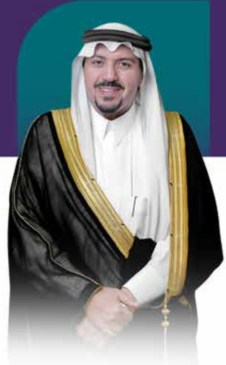
صاحب السمو الملكي الأمير الدكتور فيصل بن مشعل بن سعود بن عبدالعزيز آل سعود