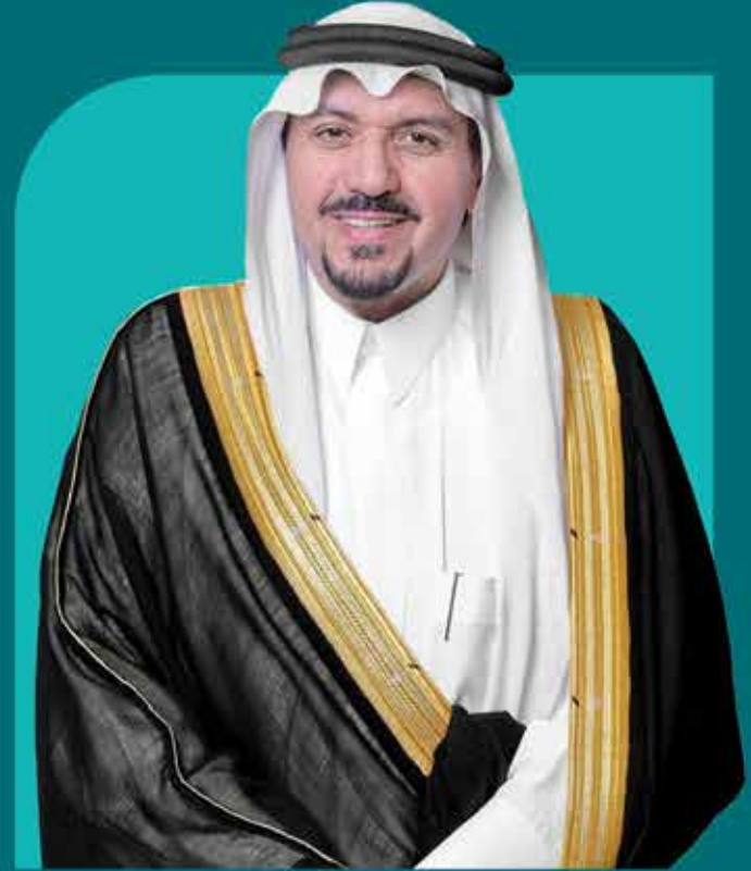
صاحب السمو الملكي الأمير الدكتور

فيصل بن مشعل بن سعود بن عبدالعزيز آل سعود