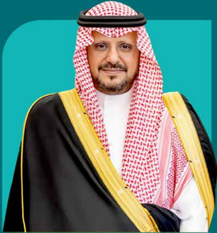
صاحب السمو الأمير

فهد بن سعود بن فيصل بن عبدالعزيز آل سعود