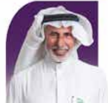
الكتور راشد بن محمد أبا الخيل نائب رئيس المجلس